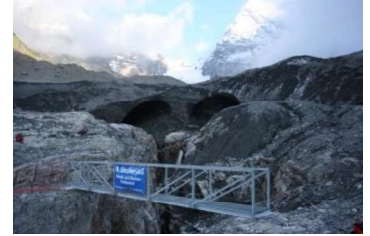
Bild: Brücke beim Gletschertor

Griesalp – Bürgli – Sefinenfurgge – Gspaltenhornhütte und zurück über Gamchialp. ACHTUNG auf Schnee- oder Eisfeld kurz nach dem Pass im Frühjahr. 6 – 7 Std.