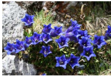
Enzian, ein Frühlingsbote