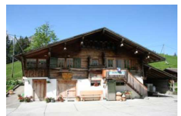
Bild: Alpkäserei Steinenberg mit Alplädeli, wo Sie sich mit feinem Käse für den nächsten Tag eindecken können.

Griesalp – Golderli – Bürgli - Gamchialp – Oberloch – Bundalp - Untere - Bundalp - Bundsteg – Steinenberg – Golderli - Griesalp. 3 – 4 Std.