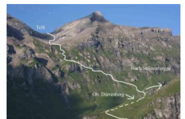
Bild: Aufstieg zum Telli

Falls gewünscht, vom Schilthorn zurück über „Rote Härd“ – Poganggenalp - Sefinenfurgge – Oberer Dürrenberg – Bürgli – Steinenberg nach Griesalp. (Versuchen Sie nicht, ab „Rote Härd“ den Hang zur Sefinenfurgge zu queren, es ist weglos und zu mühsam.)