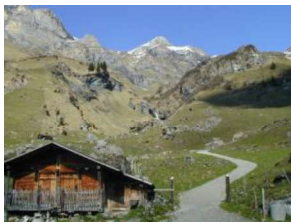
Bei der Abzweigung Bürgli