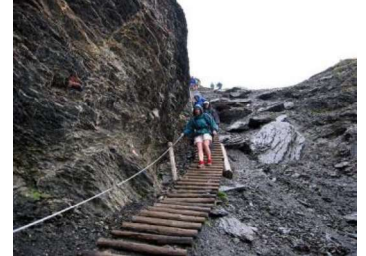
Bild: Kurz unterhalb des Passes auf der Kientalseite

Griesalp – Steinenberg – Bürgli – Oberer Dürrenberg – Telli – „Rote Härd“ – Schilthorn. (Nur für gute Berggänger. Die Tour sollte nur bei klaren und trockenen Verhältnissen, also ohne Nebel und nur im Aufstieg begangen werden weil teilweise nicht leicht zu finden, steil und ausgesetzt.)